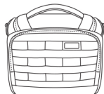
1x CORE Shoulder Bag 10L

Wskazówki, gwarancja i warunki użytkowania